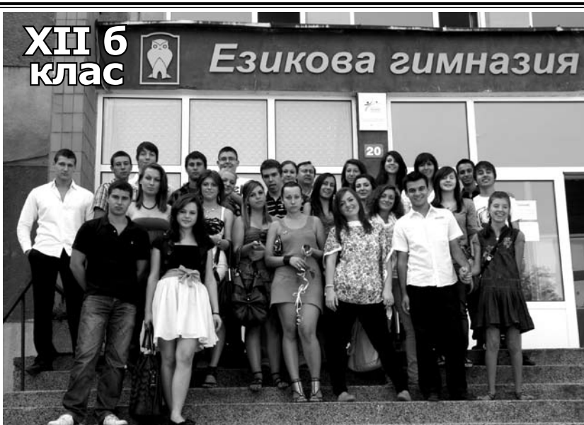
XII 6 клас

Ние сме 12А – най-добрите в града! Половината сме клоуни, другата половина сеирджии, но въпреки това всеки от нас успеха ще открие.