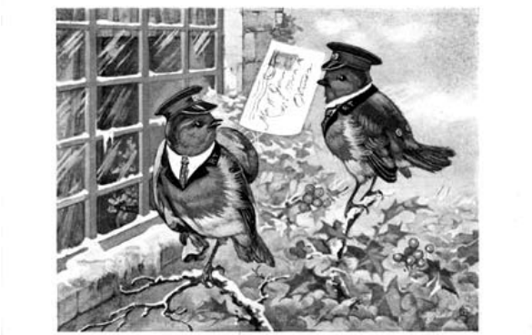
THE CHRISTMAS MORNING POST

Всички коледни пожелания, които чуеш, където и да си, ти пожелавам да се сбъднат от все сърце! Честита Коледа!