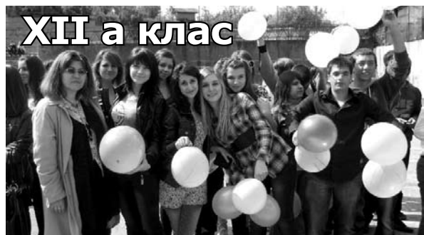
XII а клас

Айсун всички дискотеки поз-нава, но в училище не обича много много да се застоява.